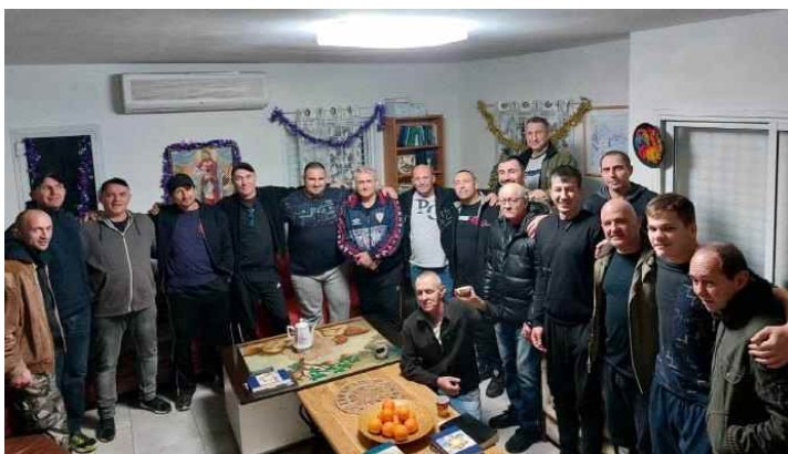
[ 리손 레-찌온 마약중독자들 평일 저녁 경건회 ]