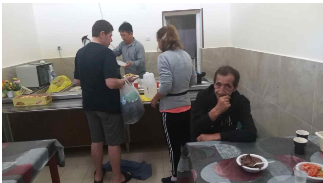
[ 무료 급식소 ]