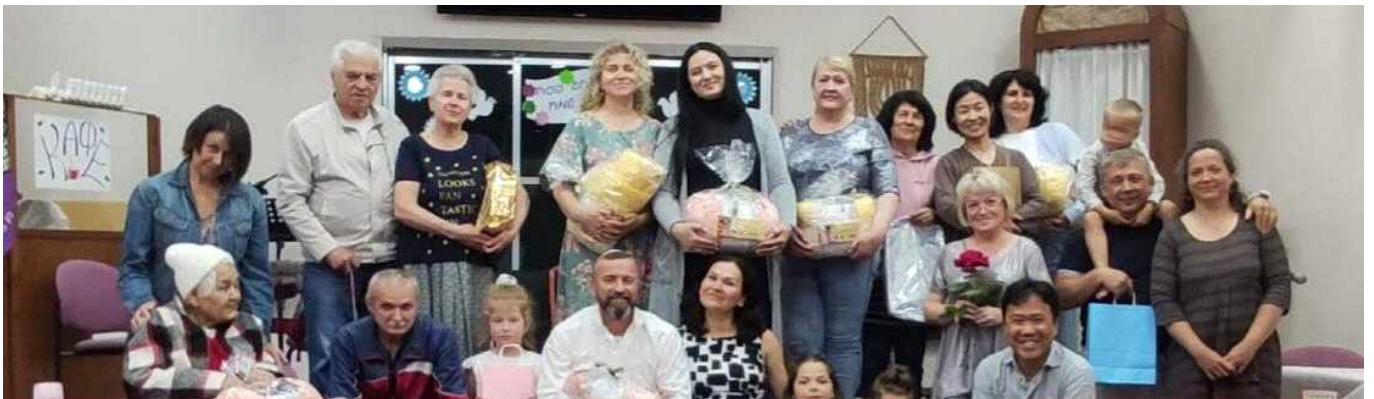
[ 나자렛 꺄 성도들 ]

부활절을 맞아 온 성도에게 선물을 한 가지씩 나눠주었습니다. 남녀노소 선물은 사람 마음을 밝게 만드는 것 같습니다. 돕는 꺄 하고 계시는 분들과 후원자분들께 사진으로 인사드립니다. "축 부활!"