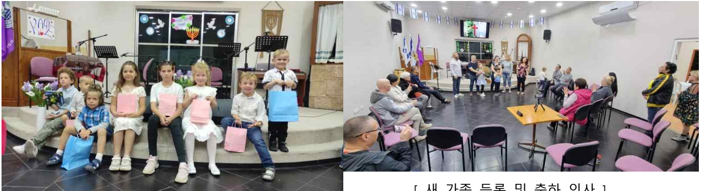
[ 새 가족 등록 및 축하 인사 ]

공하여 예#슈아를 전하는 계기도 되었으면 좋겠습니다. 이미 믿음을 갖고 있는 난민들과 2스라el 복 #음화를 위해 동역할 수 있으면 좋겠다는 소망도 있는데요, 계속 돕는 꺄 부탁드립니다.