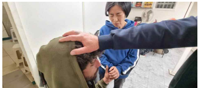
[ 기#도 요청하는 노숙-중독자들이 있을 경우, 급식소에서 함께 손을 모읍니다. ]