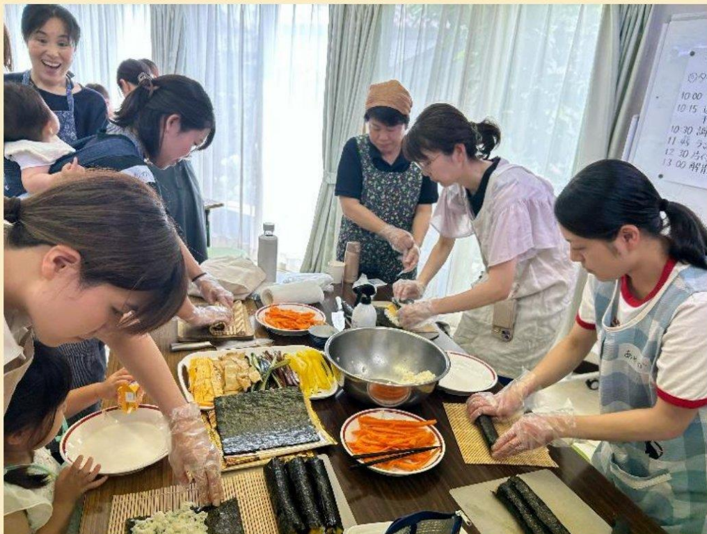
(모리오카 교회에서 김밥 교실)