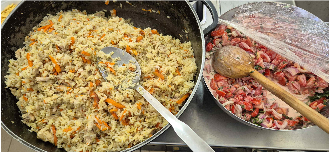
[ 무료급식소 / 의류 제공 ]

무료급식소는 현재 진행 중입니다. 의류도 나눠주고 있습니다. 폭 삶은 고기와 잘 불린 쌀밥으로 '찜 밥'을 만들었습니다. 우크라이나에서 유명한 '플롭'입니다. 양기름에 생고기를 볶아 밥을 하는 음식입니다. 치아가 좋지 않아도 섭취하기 쉽게, 식감이 부드러우도록 오랜 시간을 들여 조리했습니다. 마약/알콜 중독자와 노숙자들에게 나눌 먹거리가 떨어지지 않도록, 자원하여 봉사하는 지체들이 끊어지지 않도록, 돕는 궤 부탁드립니다.