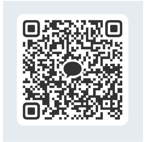
[카카오톡 QR 코드]