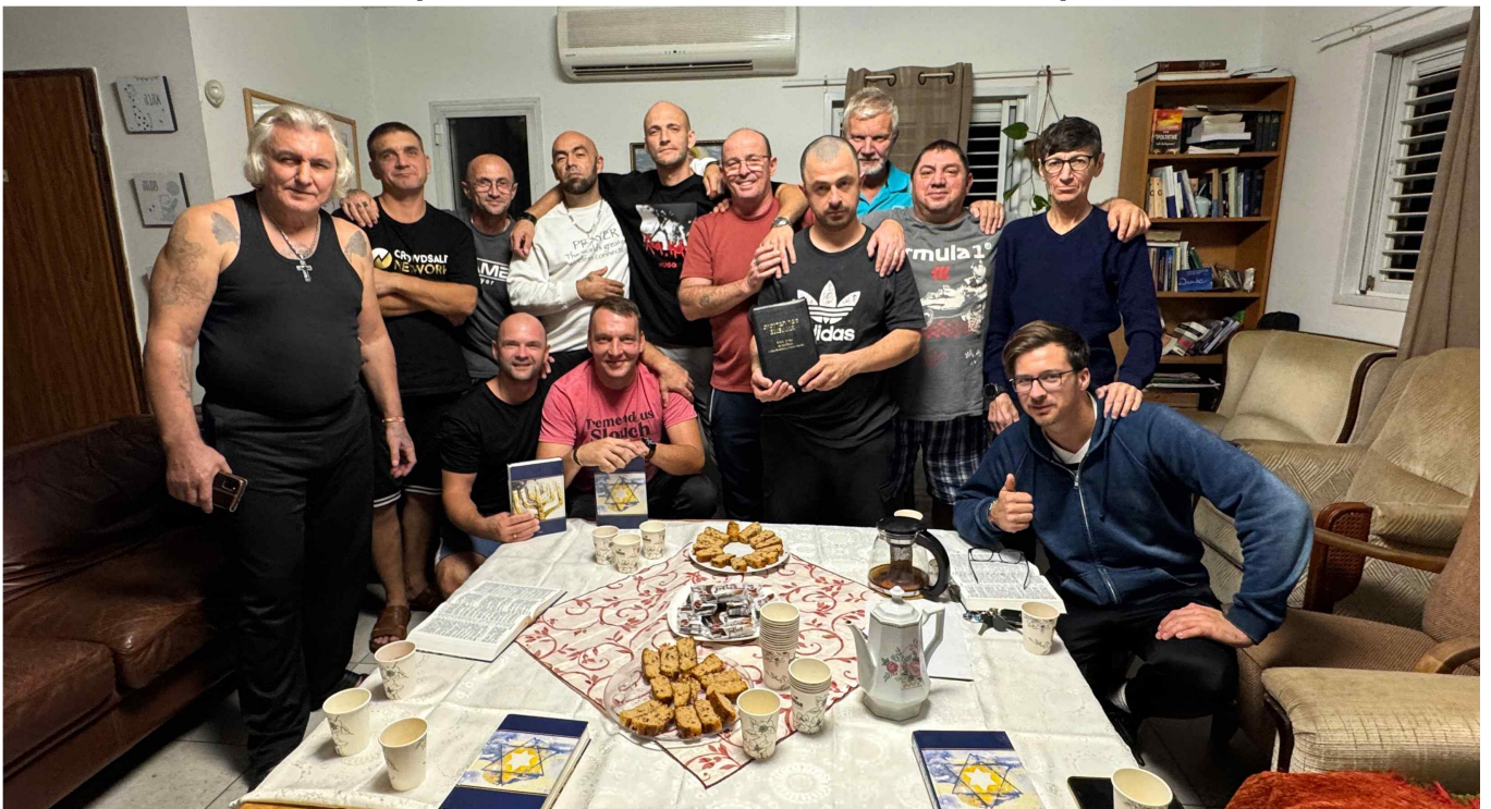
[ 마약치유센터 입소자들 / 생활 공동체 형제들 ]

마약치유센터에도 새 지체들이 계속 입소하고 있습니다. 0혼9원이 지속되도록 돕는 궤 부탁드립니다. 치유 프로그램을 이수한 지체들이 생활 공동체를 형성해 궤 주변에 살고 있습니다. 혼자 살다보면 다시 중독에 빠지기 쉽지만, 믿의 공동체가 있기에 수료 후에도 재 중독을 예방할 수 있습니다. 다시 마약에 빠지지 않고 살도록 돕는 궤 부탁드립니다.