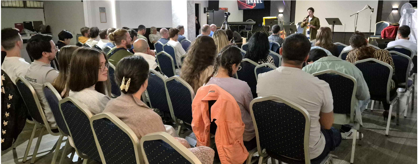
[ 리슨-레.찌온에 개척된 교회, 안식일 예배 ]

리슨-레.찌온에 개척된 교회가 부흥하고 있습니다. 예배할 공간을 새로 임대했습니다. 중독자, 비 중독자 가리지 않고 함께 예배하고 있습니다. 마약중독자들과 치유프로그램 수료자 및 중독자 가족들 그리고 전도된 초신자들이 한데 어우러지는 교회가 되었습니다. 이 예배 공동체가 말씀으로 건강하게 세워지도록, 예배할 때마다 성령 하나님 은혜로 덮어주시도록, 성령 체험과 더불어 무엇보다 '말씀'으로 성도들이 세워지도록 돕는 기도 부탁드립니다.