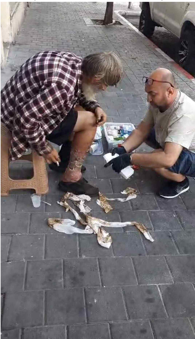
[ 무료급식소 / 중독자 환부 소독 ]