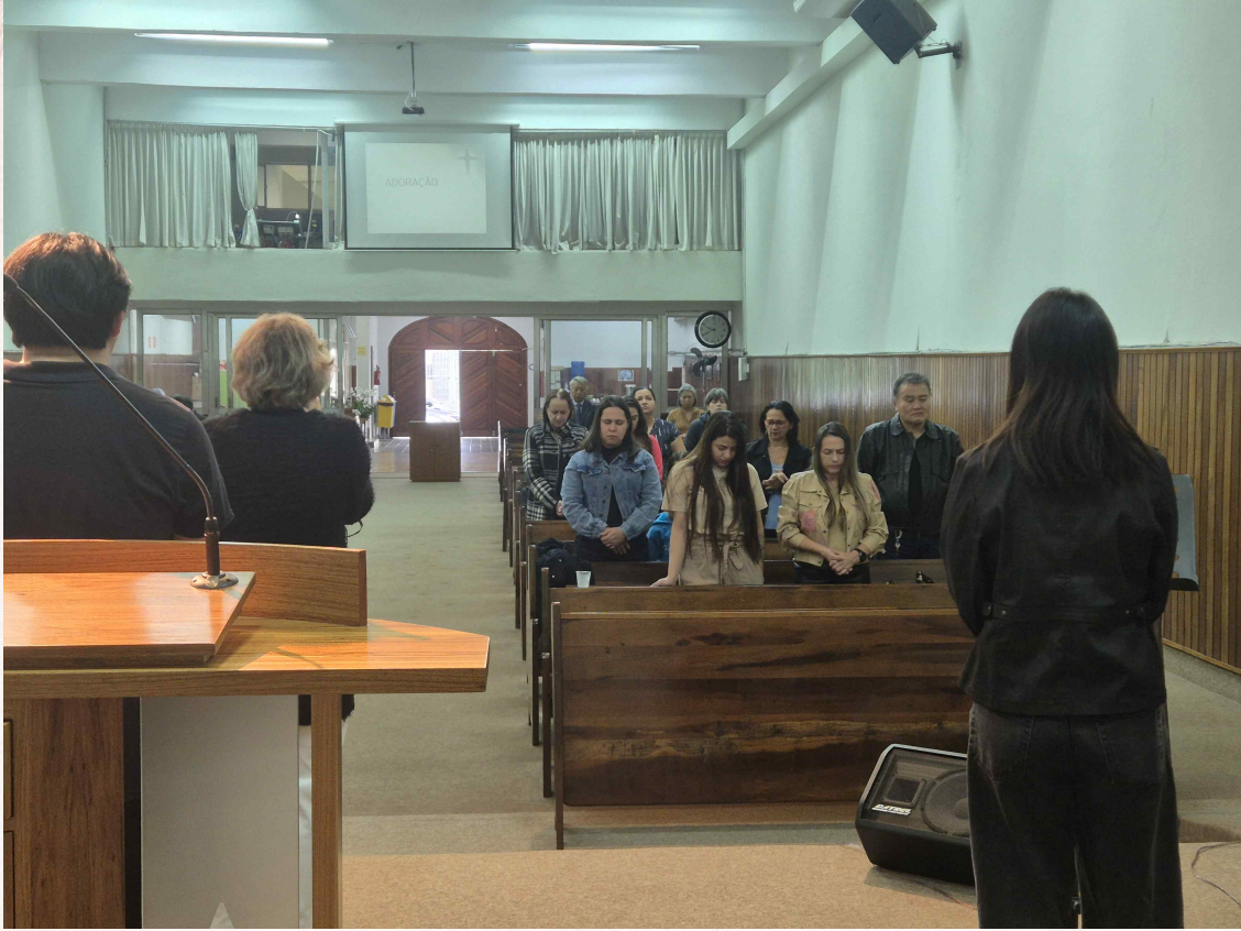
6월 22일 주일 예배