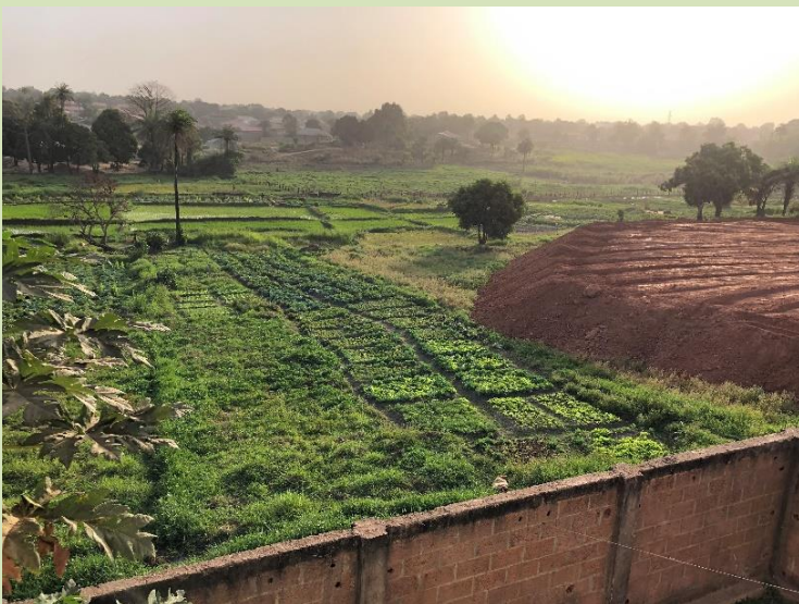
뒷면 대지(푸른 색깔)인데, 흙을 넣을 예정