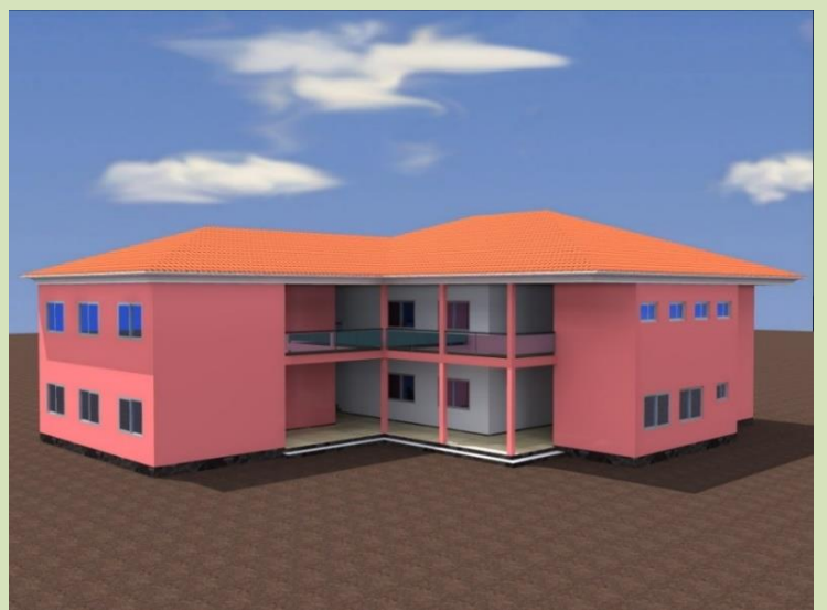
Bissau, M.K. 학교 완공 후 모습